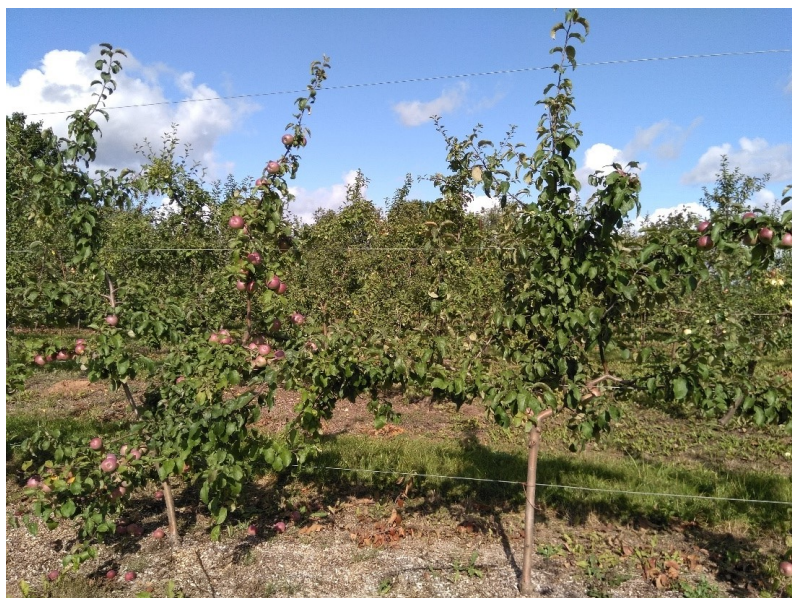
10. att. 'Belorusskoje Maļinovoje' uz potcelma B.396 ar divasu (pa kreisi) un U.F.O. (pa labi) vainagu veidošanas sistēmu