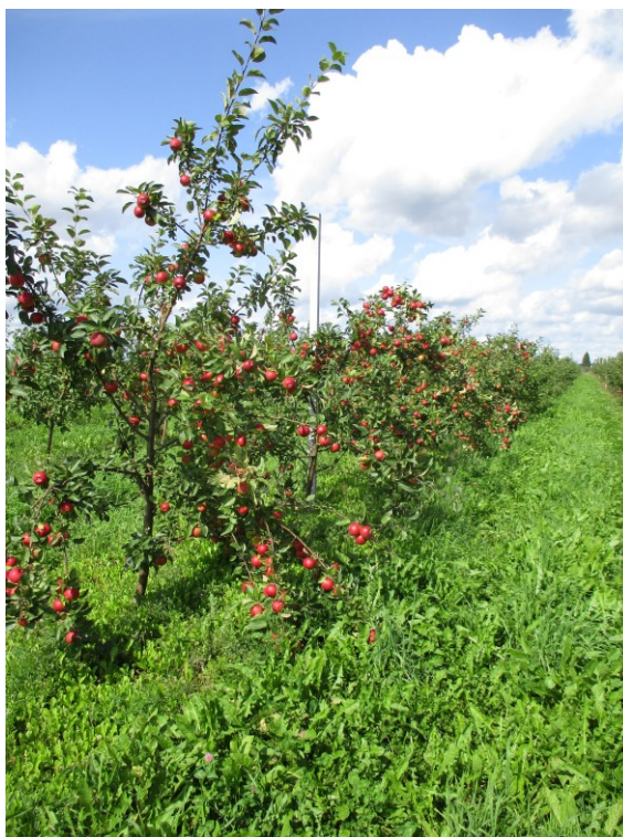
5.att. Šķirne 'Syabrina' Ziemeļvidzemē.

Laba raža bija arī saimniecībā Saldus novadā, t.sk. visām jaunajām Latvijas šķirnēm.