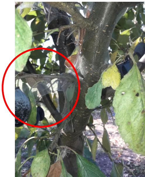
16.att. Tīklērcu masveidīga savairošanās zaru žāklēs

Ražas novākšanas laiks plūmēm sākās 10.07.2019., bet beidzās 24.09.2019. Šai laikā nokrišņu bija ļoti maz, sākās labvēlīgi apstākļi augļu koku sarkanās tīklērces attīstībai. Tiem kokiem, kam raža vēl nebija novākta, tīklērcu invāzija bija lielākā skaitā, koku pazares tika pārklātas ar tīklu, uz augļiem – tīklērces.