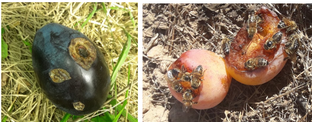
15.att. Rētaudi krusas bojātiem augļiem un bites nobirušajās plūmēs

13., 14.jūnijā atsevišķas dārza vietas tika pakļautas krusai. Daļa zaru virspusē atrodošie augļizmetņi tika mehāniski bojāti. No radītajiem bojājumiem daļa nobira, daļai augļizmetņu bojājumi aprētojās.