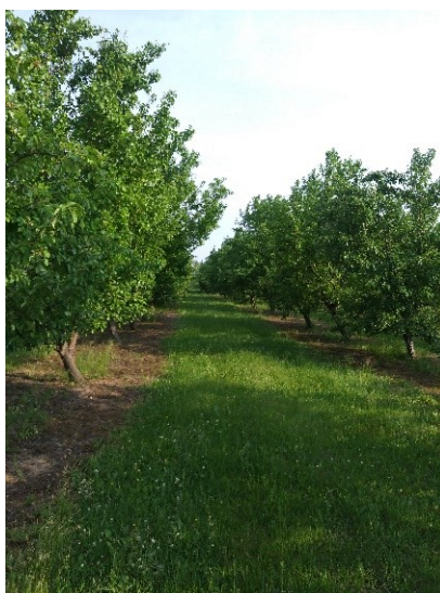
22. att. Plūmju stādījums Zemnieku saimniecībā Ventpils novadā.

Saimniecībā kopā 0.5 ha plūmes, 0.5 ha saldie ķirši. Senākais plūmju stādījums 15 gadus vecs. Šajā stādījumā pārsvarā audzētās šķirnes ir 'Viktorija', 'Komēta', 'Ulena Renklode', 'Latvijas Dzeltenā Olplūme', 'Edinburgas Hercogs'. Dārzā slimību bojājumi novēroti maz. Pavasarī dārzs miglots pret zāglapseni, plūmes bojājis tinējs. Jaunajā stādījumā pirmā raža šķirnēm 'Viktorija' un 'Komēta'. Šķirnei 'Komēta' raža neliela, augļi lieli. Varētu būt apputeksnēšanās problēmas, jo Kaukāza plūmju stādījums atrodas salīdzinoši tālu. Raža plūmju šķirnēm ir aizmetusies, bet mazāka kā citus gadus. Arī 'Latvijas Dzeltenai Olplūmei' šogad raža mazāka. Saimnieks apmierināts ar šķirnes 'Viktorija' ražu. Šajā saimniecībā tika ieteikts pamēģināt iestādīt un izmēģināt jaunās Dārzkopības institūtā izveidotās šķirnes.