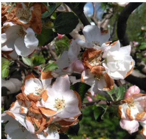
14. att. Sala bojāti ziedi 2019.gada maijā

2019. gads raksturīgs ar otro sauso gadu pēc kārtas. Veģetācijas sezona iesākās ar vērā ņemamu temperatūras pazeminājumu ziedēšanas laikā maija pirmajās dienās. Vērtējot sala bojājumus vizuāli, tika prognozēts, ka aptuveni 75% ziedu ir ar salušām drīksnām.