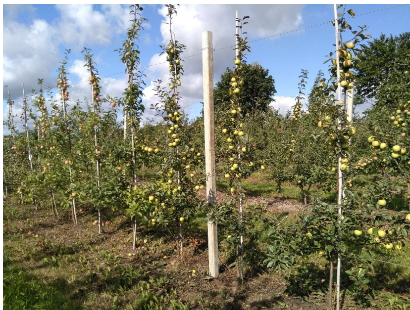
9.att. ‘Zarja Alatau’ uz potcelma B.396 blīvā dārzu sistēmā - 1 m starp kokiem, veidojot vainagu ar vienu vertikālo asi

Šobrīd ir priekšlaicīgi izdarīt konkrētus secinājumus par kādas dārzu sistēmas piemērotību t.sk. konkrētu šķirņu gadījumā, jo iegūti praktiski pirmie ražas dati, vērtējamās būtu atšķirības augļu kvalitātē, vainaga atjaunošanas ietekme, kā arī analizējams ieguldāmā darba apjoms konkrētas sistēmas izveidei un uzturēšanai.