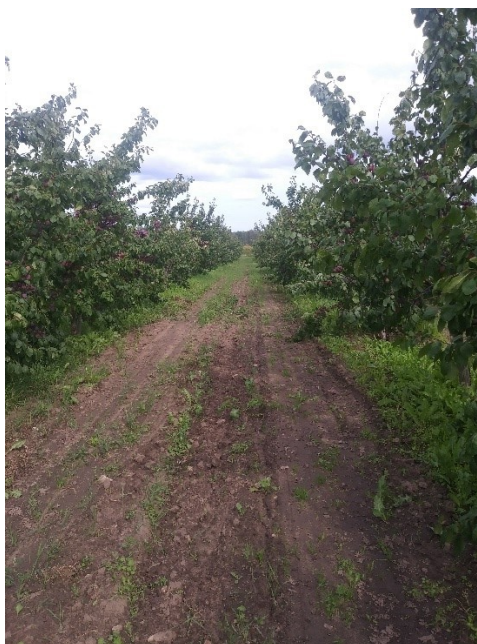
24. att. Plūmju stādījums Tukuma novada saimniecībā