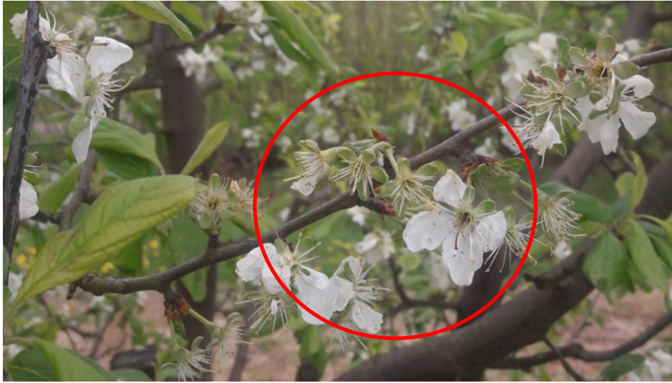
17.att. Salā cietušās auglenīcas

2019.gada pavasara salnās vairāk cieta tās šķirnes, kurām 2018.gadā bija ļoti laba raža: ‘Oda’, ‘Aļeinaja’, ‘Zarečnaja Raņņaja’ un ‘Kijevas Vēlā’. Tabulā apkopoti veģetatīvo parametru un ražas parametru rādītāji par 2018. un 2019. gadu.