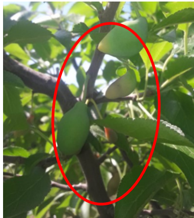
18.att. Fizioloģiskās nobires laikā noretinātie augļaižmetņi, šķirne ‘Ance’

Ja 2018.gadā bija nepieciešama ļoti spēcīga retināšana, bet neskatoties uz to, raža bija liela, augļu vidējā masa neliela, kas radīja problēmas ar ražas realizāciju, 2019. gadā fizioloģiskās nobires laikā vairums šķirnes pašas noretināja nepilnīgi attīstījušos augļaižmetņus. Tas būtiski samazināja ražu, bet augļu kvalitāte bija krietni augstāka, ko ļoti atzinīgi novērtēja produkcijas pircēji.