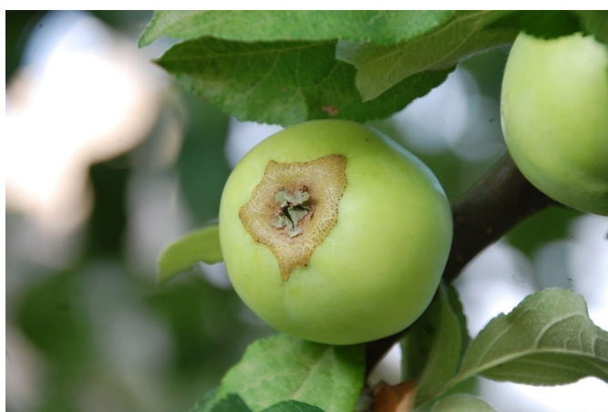
7. attēls. Salnas radīts bojājums augļizmetņim

Zināmu ietekmi šajā izmēģinājumā iegūstamajam ražas apjomam atstāja zemās temperatūras ziedēšanas laikā (salnas). Vairāk augļu sezonas beigās tika konstatēti koku vainaga daļā, kas bija augstāk virs zemes. Tāpat bija vērojami salnas radītie bojājumi augļizmetņiem pie tā kausiņa. Tomēr, salnas ietekmē vērtējams, ka tika bojātu augļu kvalitāte un nevis samazināta raža konkrētajos apstākļos, jo ziedēšanas intensitāte izmēģinājumā bija kopumā vāja, ko lielā mērā noteica ziedu attīstība iepriekšējās sezonas ražas ietekmē.