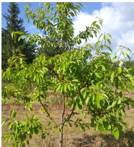
21.att. Ražojošs šķirnes ‘Anu’ koks uz potcelma ‘Gisela 5’

mahaleb ,’ un ‘Piku 1’. To varētu skaidrot ar to ka šķirne ‘Arthur’ uz visiem potcelmiem ziedēja agrāk un zemās gaisa temperatūras to skāra mazāk.