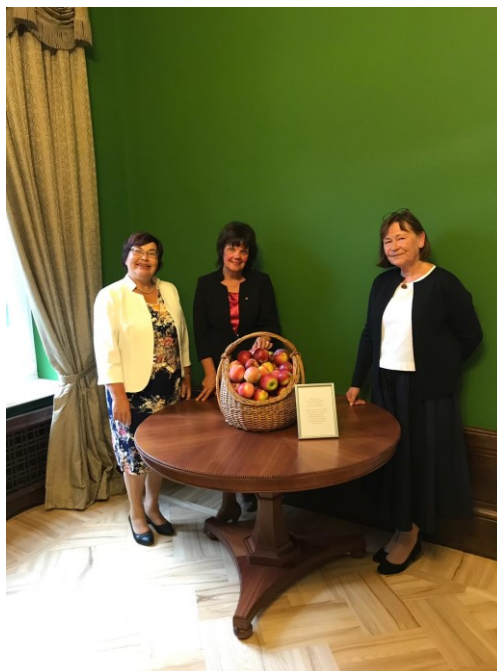
26.att. Jauna ābeļu šķirne - 'Čakstes Auči' - DI veltījums Latvijas pirmajam prezidentam Jānim Čakstem (selekcionāre L.Ikase)