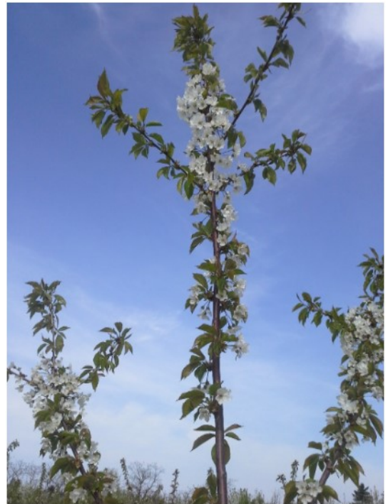
20. attēls. Ziedēšanas intensitāte šķirnei ‘Mindaugė’ uz potcelmiem Gisela 13 un Gisela 17.

Šķirnes ‘Mindaugė’ koki uz potcelmiem Gisela 13, Gisela 17 un smaržīgā ķirša novērota izteikta apikālā dominance – stingra, spēcīga galotne un piramidiāls koka vainags. Uz potcelmiem Gisela 5 un Gisela 12 audzētajiem kokiem apikālā dominance samazinājās – jaunie pieaugumi galotnēs bieži bija vājāki par sānzaru pieaugumiem, galotne mēdza nedaudz noliekties. Tādejādi koki dabiski samazināja augšanu garumā.