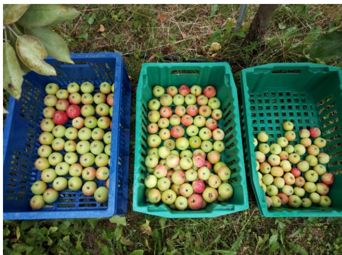
8. att. 'Konfetnoje' raža – pa kreisi atbilstošas kvalitātes bez bojājumiem; vidū atbilstoša lieluma augļi, bet ar salnas bojājumiem; izmērā par sīku (pa labi).

Visaugstākā ziedēšanas intensitāte šķirnei 'Gita', lai gan matemātiski pierādāmas būtiskas atšķirības tai bija tikai no šķirnēm 'Baltais Dzidrais', 'Kovaļenkovskoje', 'Rubin' un 'Antej'. Statistiski būtisku ietekmi uz ziedēšanas intensitāti savā ziņā ir atstājuši iepriekšējā pavasarī veiktā abeļu vainaga vienusējā mehāniskā ziedu retināšana. Nedaudz augstāka ziedēšanas intensitāte, veicot retināšanu, konstatēta šķirnēm 'Kovaļenkovskoje', 'Rubin', 'Ligol' un pat šķirnei 'Gita'. Izteiktākas atšķirības uz abiem potcelmiem starp kokiem, kur veikta un nav veikta retināšana, vērojama šķirnei 'Ligol'.