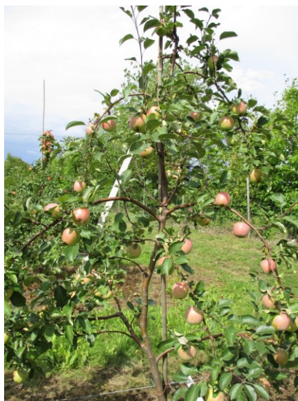
4.att. Šādam retam kokam visi augļi krusas sasisti.