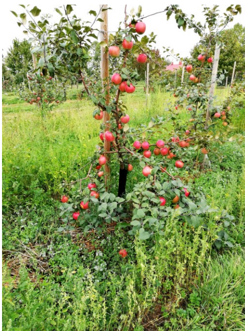
6.att. Šķirne 'Edite' Dienvidkurzemē, jauns koks.

Laba raža bija arī saimniecībā Saldus novadā, t.sk. visām jaunajām Latvijas šķirnēm.