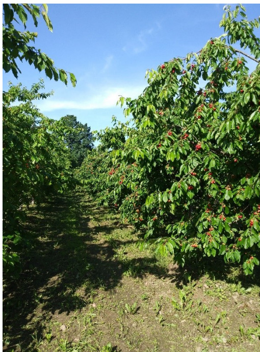
23. att. Saldo ķiršu stādījums Tukuma novada saimniecībā

Šis saimniecības ķiršu dārzā pirmsjāņu nedēļā jau bija vācama Dārzkopības institūtā izveidotā šķirne 'Paula'. Labi aizmetušās arī šķirnes 'Iputj', 'Brjanskas 3 – 36', 'Meelika', 'Aija', 'Tjučevka', 'Aija'. Šķirnei 'Tjučevka' kā negatīva īpašība, tika atzīmēta nevienāda ienākšanās. Ļoti labi neskatoties uz salnām aizmetusies šķirne 'Brjanskas 3-36'. Šajā dārzā tikušas izmantotas arī dūmu sveces un ražas zudumi ja ir, tad minimāli. Pēc saimnieka teiktā šogad nav bijušas problēmas ar ķiršu mušu.No skābo ķiršu šķirnēm saimniecībā audzē šķirni 'Latvijas Zemais, kas ir pašu saimniecībā pavairoti, pilnīgi viendabīgi kloni.