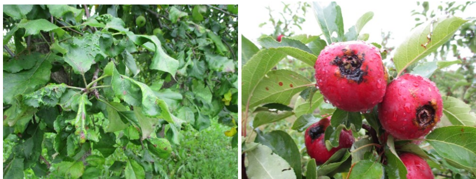
1.att. Salnas bojātas lapas ‘Sinap Orlovskij’ 2.att. Salnas bojāti augļi plaisā un pūst