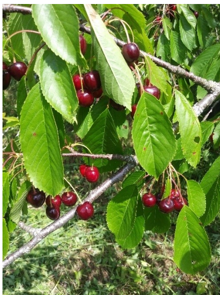
25. att. Saldo ķiršu šķirne 'Meelika' Alsungas novada saimniecībā

No plūmju šķirnēm saimniecībā tiek audzētas šķirnes 'Renklod Raņņij Doņeckij', 'Edinburgas Hercogs', 'Ontario' 'Kolonovidnaja'.