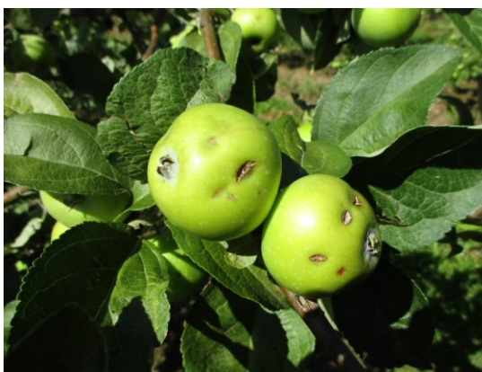
3.att. Krusas stipri bojāti augļi Ziemeļkurzemē.