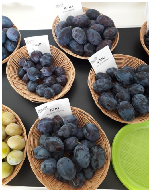
19.att. V.Hartmana šķirnes un hibrīdi degustācijā Dārzkopības institūta lauku dienās

Vērtējot ražu un augļu vidējo masu, jo otro gadu vērtējama raža nav šķirnei 'Felsina', ļoti neliela raža šķirnei 'Azura'. Izteikti ražīgs hibrīds, ar ļoti lielu augļu masu un ļoti labu augļu kvalitāti ir H-7286.